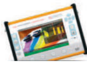
HD RANGER UltraLite