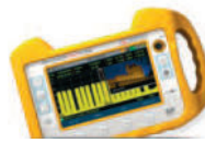
RANGER Neo Lite