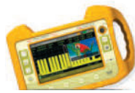
HD RANGER Eco