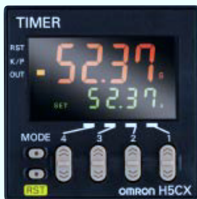
- Temporizador - Temporizador doble