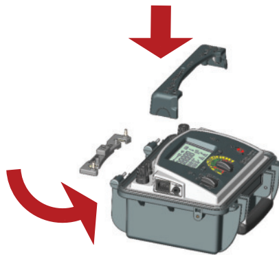
Adaptador de terminal Dos partes, puente terminal P y cubierta superior