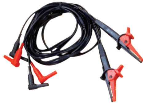
Pinzas Kelvin compactas con clasificación CAT IV 600 V de 2 m, enchufes revestidos de 4 mm