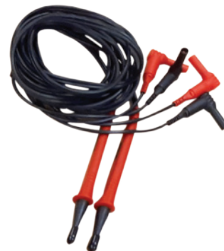
Sondas Kelvin compactas con clasificación CAT IV 600 V de 2 m, enchufes revestidos de 4 mm.