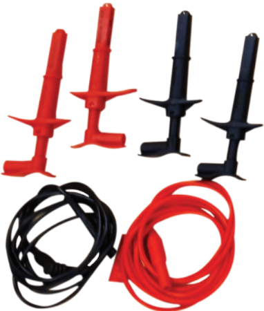
Conjunto de cables de puente de 0,5 m (se utilizan para unir los núcleos del cable al núcleo que se está midiendo)