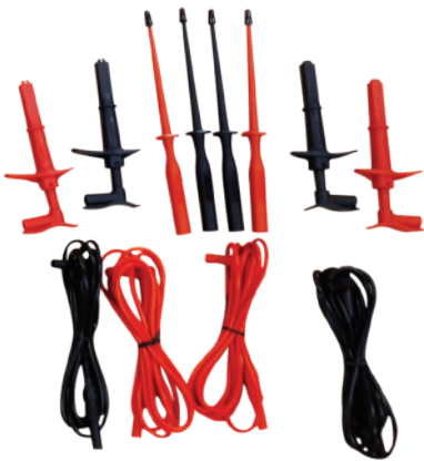
Conjunto de cables de corriente y potencial 2 m (cuatro cables) con pinzas y sondas