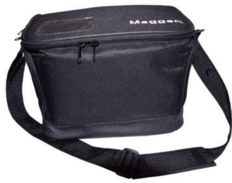
Funda de transporte